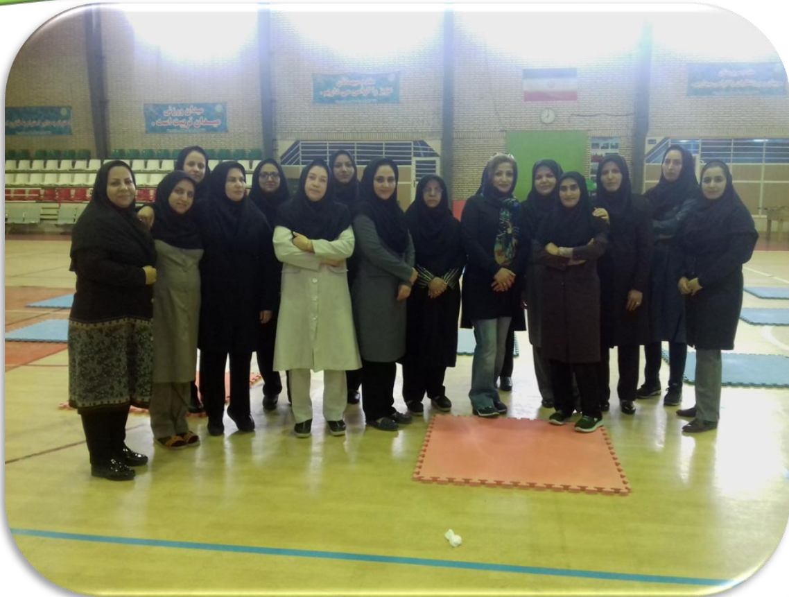
فزهنگی و فوق برنامه دانشگاه پیام نور مرکز سیرجند